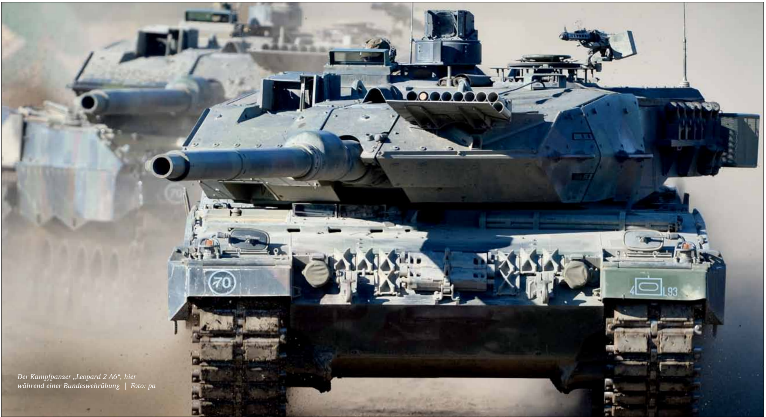
Der Kampfpanzer „Leopard 2 A6“, hier während einer Bundeswehrübung

Gefertigt werden die acht Boote auf der Lürssen-Werft im vorpommerschen Wolgast. Rund 300 Arbeitsplätze sollen dort an dem Auftrag hängen. Bereits vor dem Patrouillenbootdeal hatte die damals allerdings noch geschäftsführende Bundesregierung Einzelausfuhrgenehmigungen im Wert von 161,8 Millionen Euro an die Saudis erteilt. Saudi-Arabien avancierte damit – im ersten Quartal 2018 – sogar zum Hauptabnehmer von deutschen Rüstungsgenehmigungen.