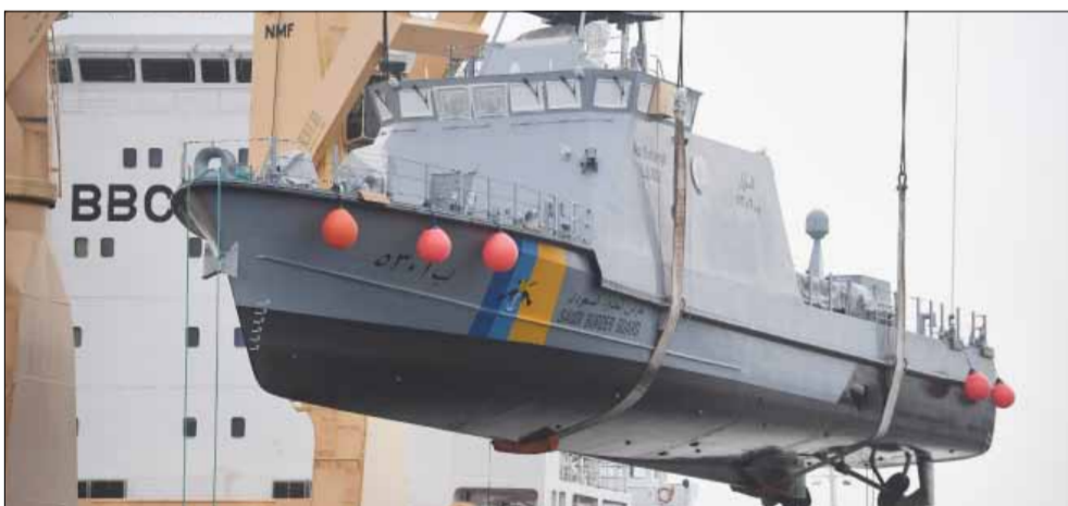
Ein Patrouillenboot für Saudi-Arabien wird verladen. Gebaut wurde es im vorpommerschen Wolgast.

Viel klarer kann eine Formulierung kaum sein: „Wir werden ab sofort keine Ausfuhren an Länder genehmigen, solange diese unmittelbar am Jemen-Krieg beteiligt sind“, heißt es in dem Koalitionsvertrag zwischen SPD, CDU und CSU, den die Spitzen der drei Regierungsparteien am 12. März 2018 feierlich unterzeichnet haben. Doch nur zehn Tage später sollte die im Koalitionsvertrag – immerhin an sieben verschiedenen Stellen – breit angekündigte „restriktivere Rüstungsexportpolitik“ kaum mehr als Schall und Rauch sein. Im Wirtschaftsausschuss teilte Wirtschaftsminister Peter Altmaier (CDU) dem verduzteten Parlament mit, dass die Regierung die Lieferung von acht Pa-